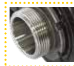
Filetto esterno External thread