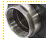
Filetto interno Internal thread

They are a modular toolholder system for the fitting of toolholders in a spindle unit with ER collets (DIN6499) outputs. All Adaptors are suitable for external and internal coolant supply and keep the presetting already done.